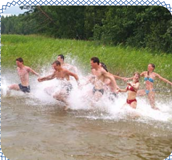
Энергичный отдых у озера (стр. 11)