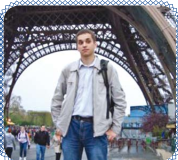
Научная карьера во Франции (стр. 6)