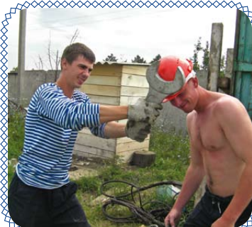
Стройотряды: работа и не только... (стр. 5)