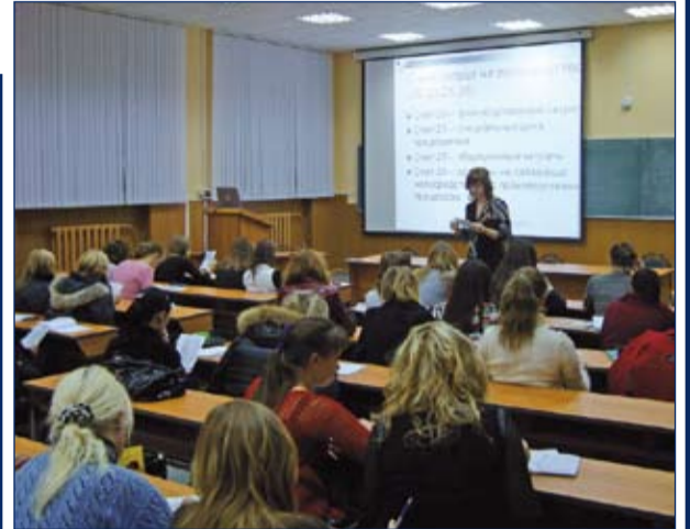
«Центр экономики и финансов»: новая грань ИГЭУ (стр. 2)