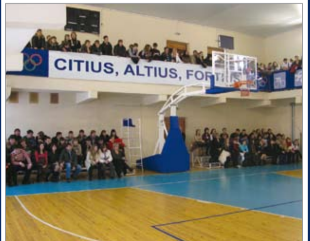
Спортивная жизнь вуза: мы по-прежнему в форме! (стр. 7)