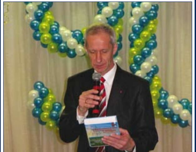
Юбилей ИВПИ – это целая история! (стр. 4)