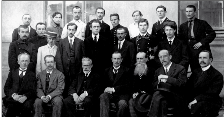
Преподаватели и студенты ИВПИ, 1922 г.

В мае 1918 г., когда решался вопрос о возможном возвращении эвакуированного Рижского политехнического института обратно в Латвию, преподавателям вуза поступило предложение переехать в Иваново-Вознесенск. С предложением от имени ивановцев выступил М. В. Фрунзе, который возглавил комитет по организации Политехнического института.