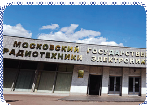
Повышаем квалификацию (стр. 6)