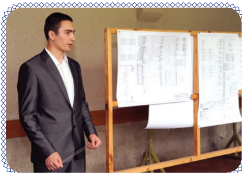
Защиты по-английски (стр.4)