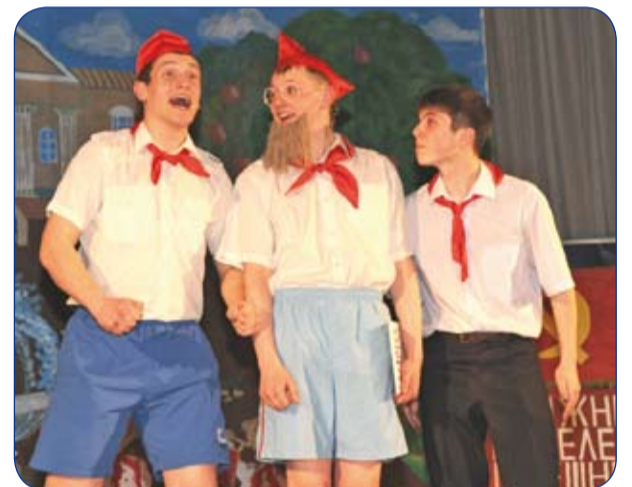
«СТЭМ – Энерго»: дома и в гостях (стр. 6, 8)