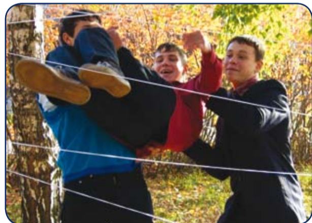
Новый рекорд по метанию первокурсника!

КОМПЬЮТЕРНЫЕ КУРСЫ ИНФОРМАЦИОННО-ВЫЧИСЛИТЕЛЬНОГО ЦЕНТРА ИГЭУ