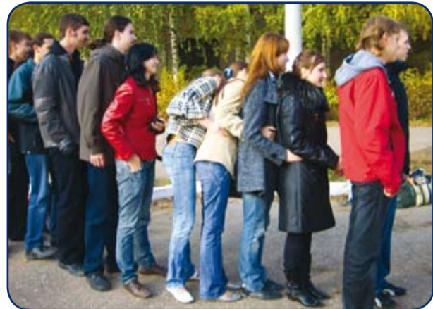
Кто последний за пятерками?

С 30 сентября по 3 октября в ИГЭУ прошел первый традиционный этап посвящения студентов в первокурсники под названием «Вербочный курс».