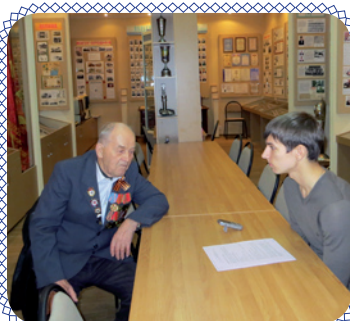
У войны не детские глаза... (стр. 5)