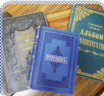
Книжные редкости (стр. 7)