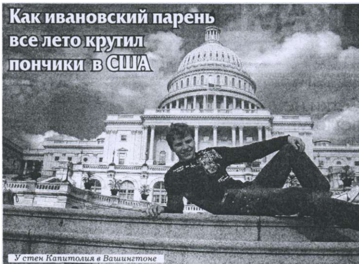
Как ивановский парень все лето крутил пончики в США