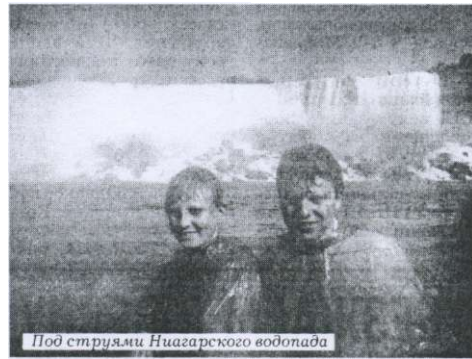
Под струями Ниагарского водопада