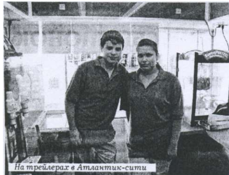
На трейлере в Атлантик-сити

Вокруг крутили пальцем у виска, мол, зачем едешь - кризис ведь на дворе. И правильно крутили! Через