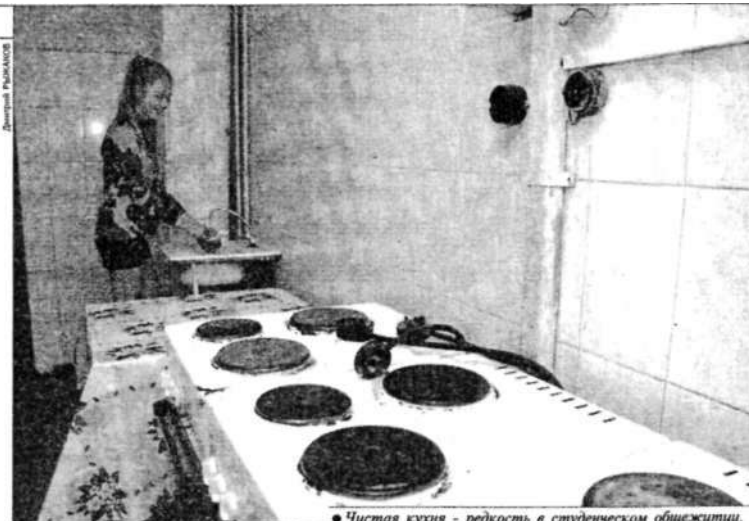
● Чистая кухня - редкость в студенческом общежитии.

Совсем недавно в их студенческом домике появилась новая комната отдыха. Больше прежней раза в два. Кожаные диваны, кресла, телевизор и столы. Жилье комнатки студентов махонькие. Почти в каждой - двухъярусные кровати. Мальчишки смастерили крепления на стене - теперь между кроватями располагается компьютерный уголок. При входе в комнату - кухня, где ребята обедают и пьют чай. Готовят тоже на кухне. За собой обязательно вымывают плиту и выносят мусор. Ленивые или особо занятые студенты замаривают червячка в столовой. Для этого обувают до-