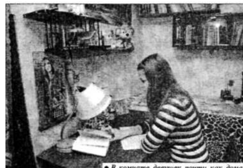
● В комнате девушек почти как дома.

Общежитие энергоуниверситета на ул. Парижской Коммуны богато юными энтузиастами. Глаз старосты этажа не дремлет и следит за любыми провинностями. Не вынес мусор - неделя уборки тебе в наказание, шумел после одиннадцати - никаких тебе праздников на месяц. А гуляют ребята с размахом.