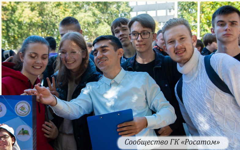
Сообщество ГК «Росатом»