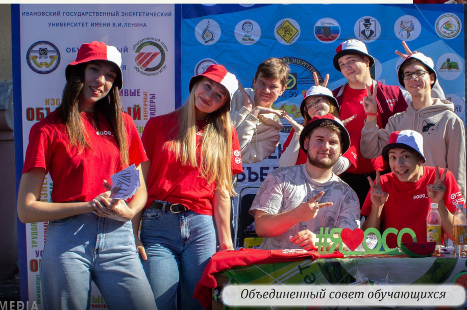
Объединенный совет обучающихся

«Подготовка была недолгой. Больше времени ушло на подготовку документов для проведения мероприятия именно на парковочных местах перед корпусом А. Раньше данное мероприятие проводилось в холле корпуса «А», там всегда образовывались «пробки», поэтому нужно было найти просторное место, но с такой же проходимостью. Прогноз погоды на 13 сентября был хорошим, поэтому все сложилось удачно.