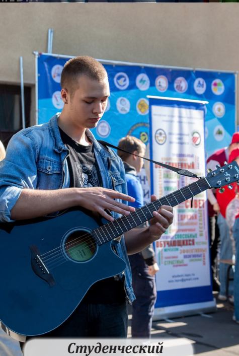
Студенческий культурный центр

Но наша цель, как органа студенческого самоуправления, не только собрать команду, но и просто рассказать студентам о том, куда обращаться со своими инициативами и познакомить их с максимально возможным количеством объединений, чтобы любой студент мог найти что-то интересное для себя».