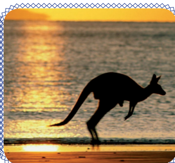
Осваиваем новые континенты! (стр. 4 - 5)