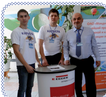
«Двойной выпуск»: итоги распределения (стр. 3)