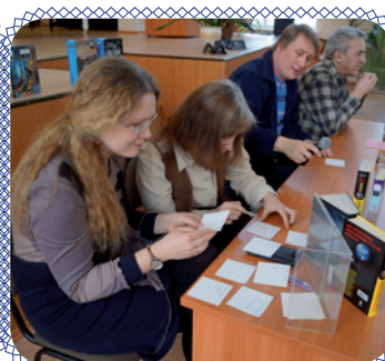
Экзамен для писателей (стр. 9)