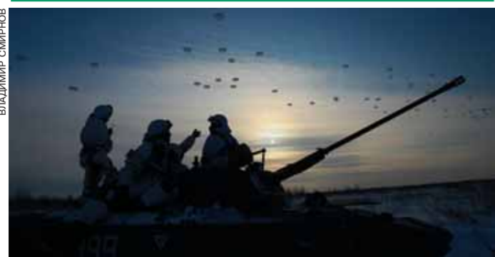
Ивановские гвардейцы-десантники (98-я дивизия ВДВ) произвели массовую учебную высадку в Костромской области.