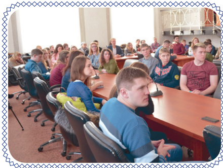
Обратная связь (стр. 2)