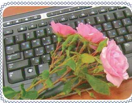
Спасибо! (стр. 7)