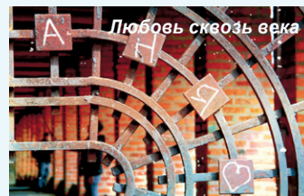
Любовь сквозь века