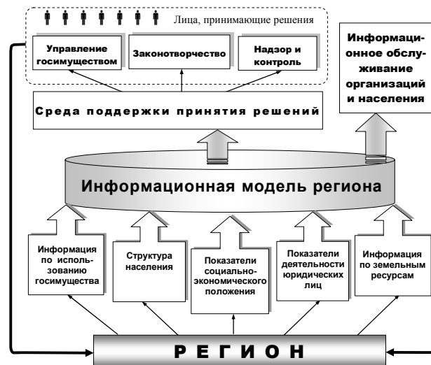
Рис. 1. Состав РИАС ОГВ

Комплекс хранилищ данных, поддерживающих информационную модель региона, является платформой, интегрирующей информационно-аналитические приложения (подсистемы). Речь идет не только о подсистемах, включенных в состав РИАС ОГВ, но и любых других разработках, в которых имеется заинтересованность региональных администраций.