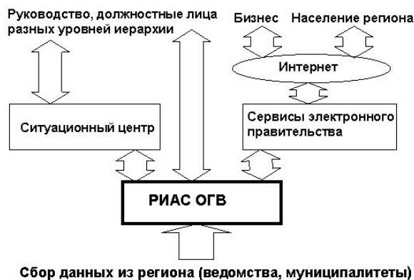
Рис. 4. РИАС ОГВ как база для ситуационного центра и сервисов электронного правительства

Дальнейшее развитие системы подразумевает увязку ее в ситуационный центр и создание сервисов электронного правительства (рис. 4).